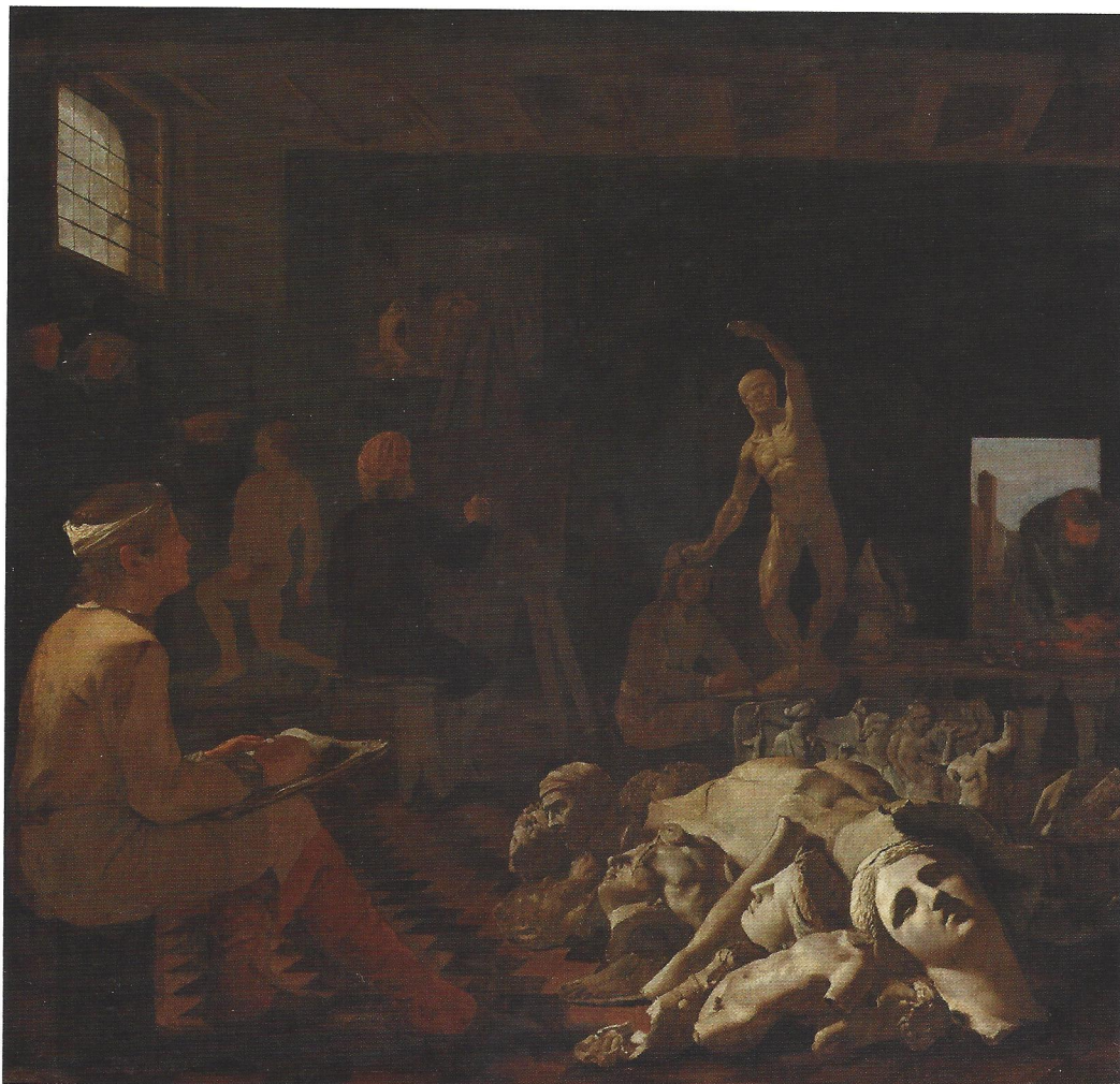
Afb. 3 Michiel Sweerts, Het schildersatelier , ca. 1646 - ca. 1650, olieverf op doek, 71 x 74 cm, Rijksmuseum, Amsterdam