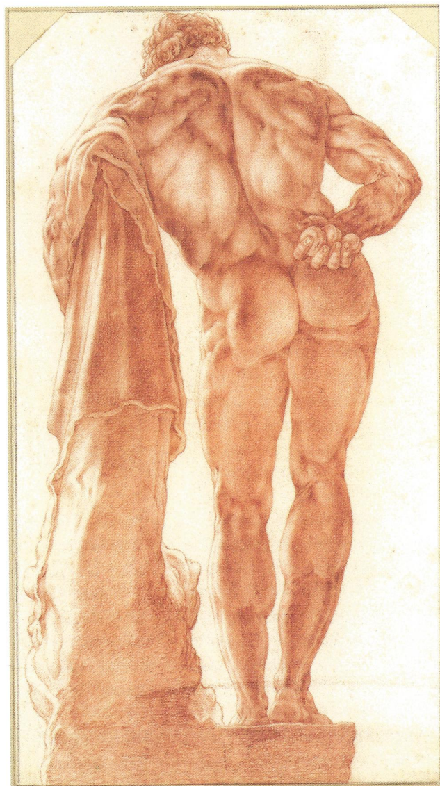
Afb. 1 Hendrick Goltzius, Hercules Farnese op de rug gezien , ca. 1592, gravure, 42 x 30 cm, Teylers Museum, Haarlem

Al rond 1500, in een tijd dat er veel opgravingen in Rome werden gedaan, lieten kunstenaars zich direct inspireren door de sculpturen uit de klassieke oudheid. De beroemde Hercules Farnese (afb. 1) vond men omstreeks 1540 in diverse fragmenten. De benen vond men uiteindelijk te laat, want toen was het beeld al 'gerestaureerd'. Een van de weinige antieke beelden die niet is gerestaureerd is de Torso Belvedere. Dit fascinerende fragment genoot een bijna mythische status, mede door de lovende woorden van Michelangelo die zich ook door de Torso liet inspireren. Zeer veel kunstenaars hebben de Torso in het Vaticaan of een gipsen kopie ervan nagetekend, onder wie, onverwacht wellicht, ook de beroemde landschapsschilder J.M.W. Turner (afb. 2). De verschillende stadia van de academische opleiding, zoals anatomiestudie, tekenen naar een klassiek beeld en werken