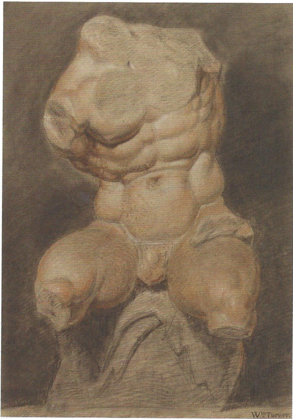
Afb. 2 Joseph Mallord William Turner, Studie van een pleisterbeeld van de Torso Belvedere , 1789, zwart, rood en wit krijt op bruin papier; 33 x 23,5 cm, Victoria and Albert Museum, Londen

naar naakt model, worden fraai uitgebeeld in het werk Het schildersatelier van Michiel Sweerts uit circa 1650 (afb. 3). Op de voorgrond, in een bundel van licht, krijgt de antieke beeldhouwkunst alle aandacht. Dit maakt het schilderij een treffende illustratie van het thema van deze tentoonstelling.