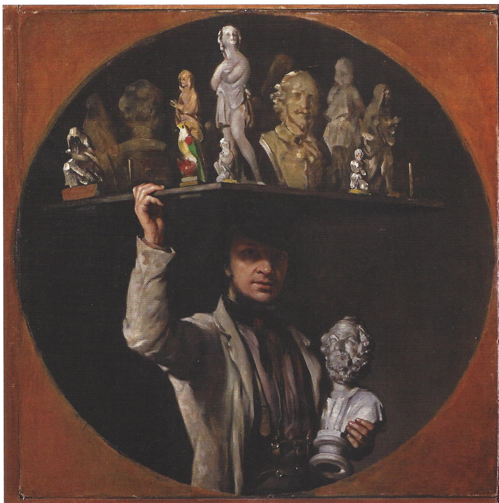
Afb. 5 William Daniels, Zelfportret met pleisterbeelden ('The Image Seller') , ca. 1850, olieverf op doek, 43 x 43 cm, Katrin Bellinger Collection

die in ontspannen houding, maar niettemin aandachtig, een antieke buste natekent.