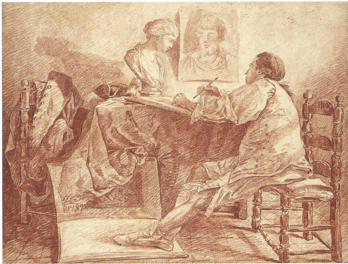
Afb. 4 Hubert Robert, Een kunstenaar zittend aan een tafel, een borstbeeld van een vrouw tekenend , ca. 1765, rood krijt, 33 x 44 cm, Katrin Bellinger Collection